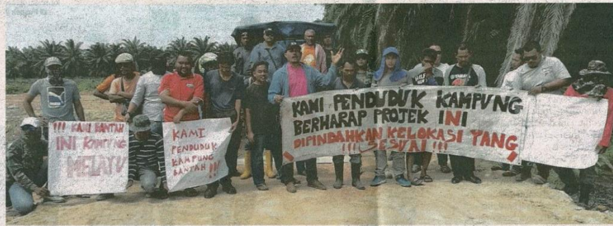
Sebahagian penduduk yang berhimpun secara aman membantah projek tanah perkuburan Hindu dan Kristian di Jalankandi Kampung Sungai Kelambu.

"Malah penduduk tertanya-tanya kenapa perlu bina kawasan per-